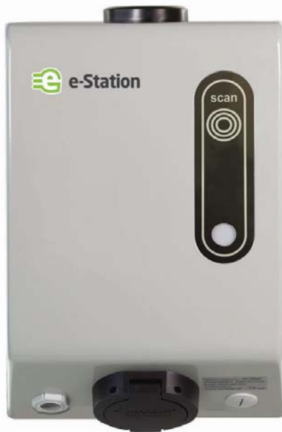
TIPO 2 (Mennekes) VDE-AR-E 2623-2-2

La stazione di ricarica per veicoli elettrici ideale per offrire un servizio di ricarica al pubblico